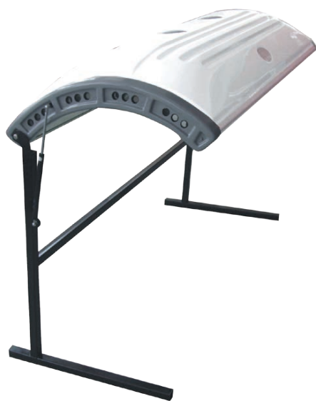
Fine-Lite CORPO スタンド

全身コラーゲンカプセル「コルポ」 / マシンの中で寝ているだけで全身エステが可能！ 633nmの可視光線を出す良質な赤色LEDが全身を包みこみます。