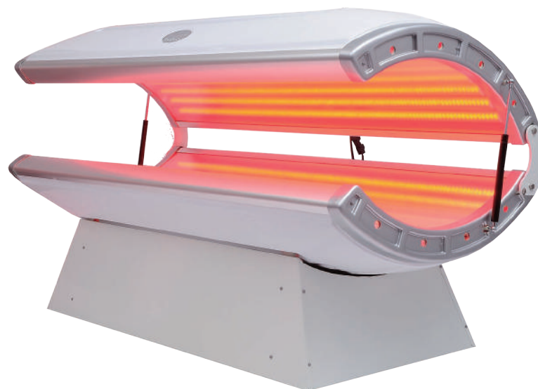
Fine-Lite CORPO ベッド